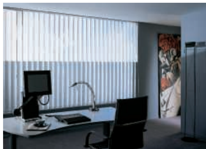
Vertikal-Jalousie mit Tageslichtnutzung

Jalousien • Raffstoren • Verbundraffstoren • Gelenkarm-Markisen Fallarm-Markisen • Fassaden-Markisen • Markisoletten • Wintergarten- Markisen • Korb-Markisen • Kassetten-Markisen • Senkrecht-Markisen Fertig-Rollläden • Rollos • Vertikal-Jalousien • faltstores • Insektenschutz Verdunkelungsanlagen • Tageslichtsysteme • Steuerungen