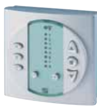
EWFS Wandsender (optional)