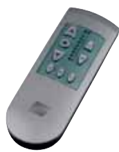
EWFS Handsender (optional)