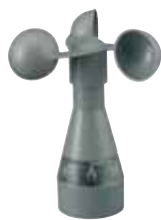
Messwertgeber Wind/Photo (180°)

Die Minitronic dialog wird in einer tiefen UP-Schalterdose installiert. Für Aufputzmontage steht ein Gehäuse im abgestimmten Design zur Verfügung.