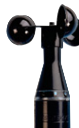
MWG Wind/Photo MWG Wind/Photo/Funkuhr (bei Wisotronic dialog 2/3-Kanal)